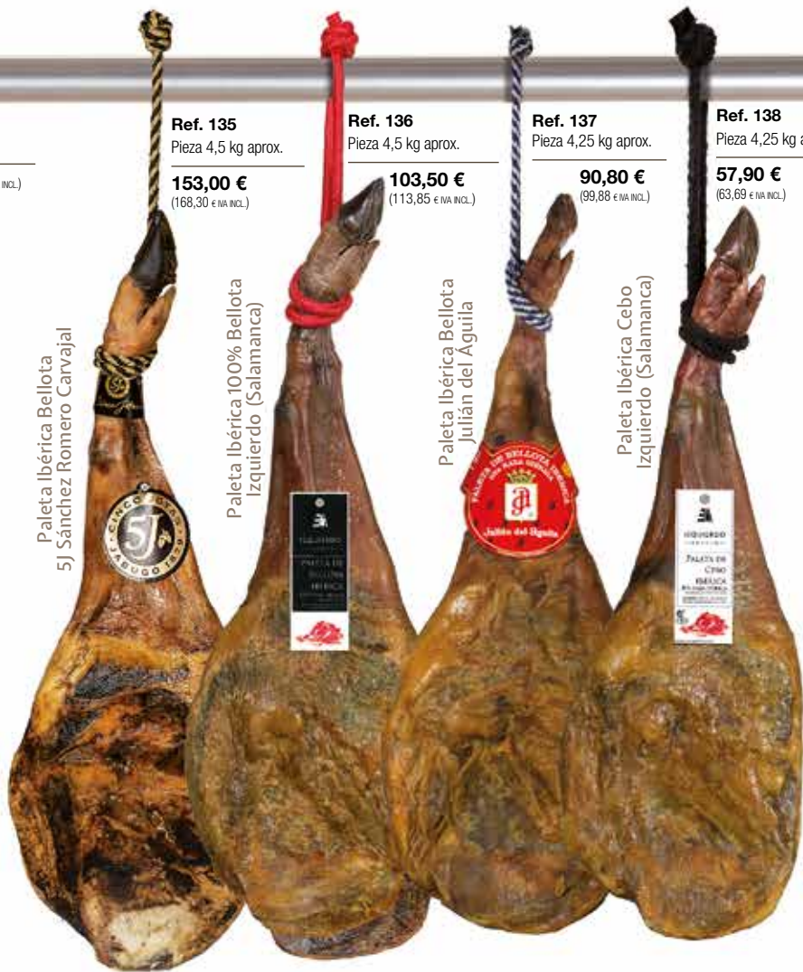
Paleta Ibérica Bellota 5J Sánchez Romero Carvajal

Ref. 134 Pieza 7 kg aprox. 84,90 € (93,39 € IVA INCL.)