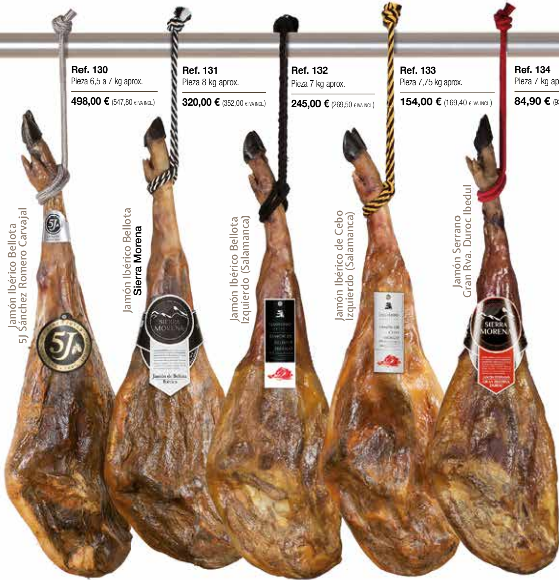
Jamón Ibérico Bellota 5J Sánchez Romero Carvajal

Ref. 130 Pieza 6,5 a 7 kg aprox. 498,00 € (547,80 € IVA INCL.)